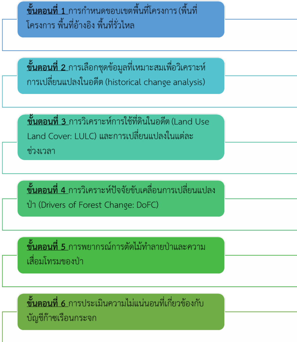
ภาพที่ 1 ขั้นตอนการพิจารณากรณีฐานและการปล่อยก๊าซเรือนกระจก

การกำหนดกรณีฐานและการพิสูจน์ส่วนเพิ่มฯ ใช้ เครื่องมือคำนวณ T-VER-P-TOOL-01-01 การกำหนดกรณีฐานและการพิสูจน์การดำเนินงานเพิ่มเติมจากการดำเนินงานตามปกติสำหรับกิจกรรมโครงการป่าไม้ (Combined Tool to Identify the Baseline Scenario and Demonstrate Additionality in Forest Project Activities)